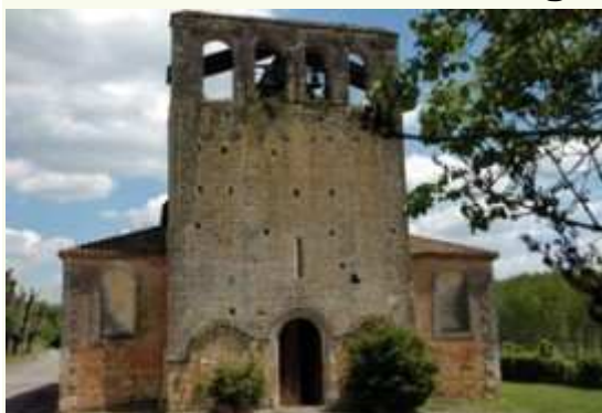
L'église du Coux

Le Coux et Bigaroque est une charmante petite commune de Dordogne, située en plein cœur du Périgord Noir.