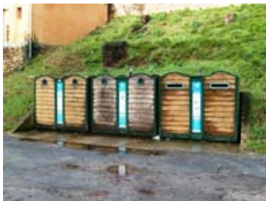
Photo 2.4.4 Point d'Apport Volontaire