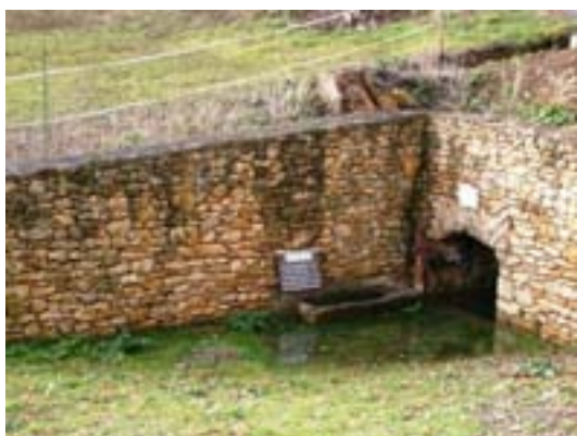
Photo 3.1.1.4.a Fontaine