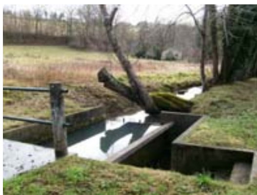
Photo 3.1.1.4.b Lavoir et Ruisseau Le Boule