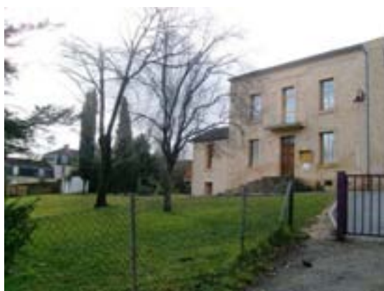
Photo 3.2.3 Centre de loisirs