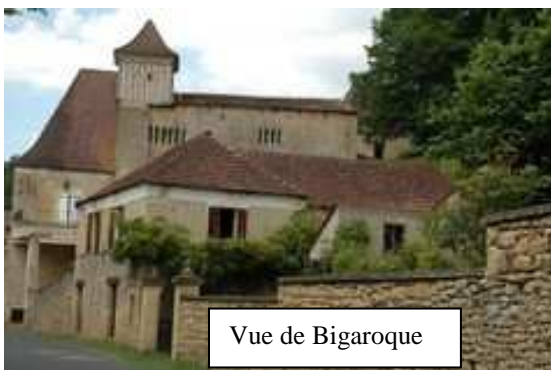
Vue de Bigaroque