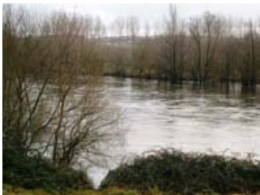
Photo 2.2.1 La Rivière Dordogne